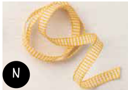
Ruban Vichy Beau Bourdon