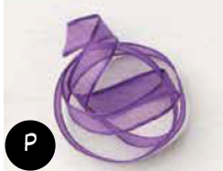
Ruban extra-fin Grappe Gourmande