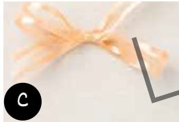
Ruban à tissage léger Epinette enivrante Freesia en fleur Papaye pâle Pierre Rose polie Soyeuse Succulente