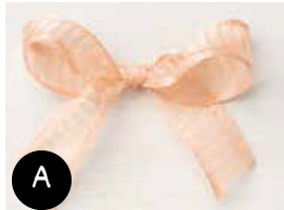
Ruban d'Organdi rayé Pétale de rose