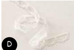
Galon en dentelle festonné Très vanille