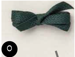
Ruban à tissage en chevrons Epinette Enivrante