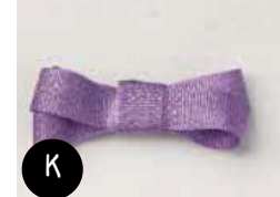
Ruban gros grain Horizon de Bruyère