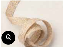
Ruban Beaux Arts Or