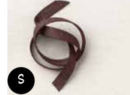
Galon en faux suède Couleur Café