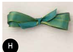
Ruban réversible Vert Olive/Paon Pim pant