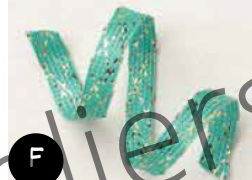
Ruban tressé Juste Jade et Or