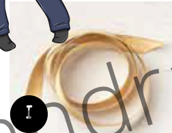
Ruban miroitant Or