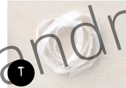
Galon plissé Blanc