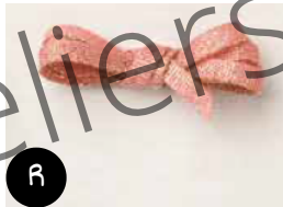
Ruban métallisé Flamant fougueux doré