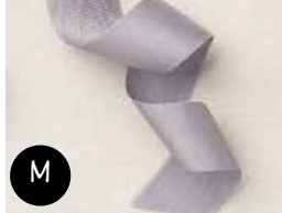
Ruban texturé Ardoise Bourgeoise