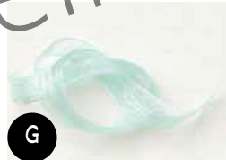
Ruban Extra-fin Piscine Party