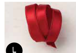
Ruban satin double surpiqûre Rouge rouge