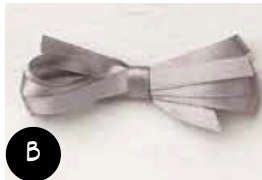
Ruban miroitant Gris Granite